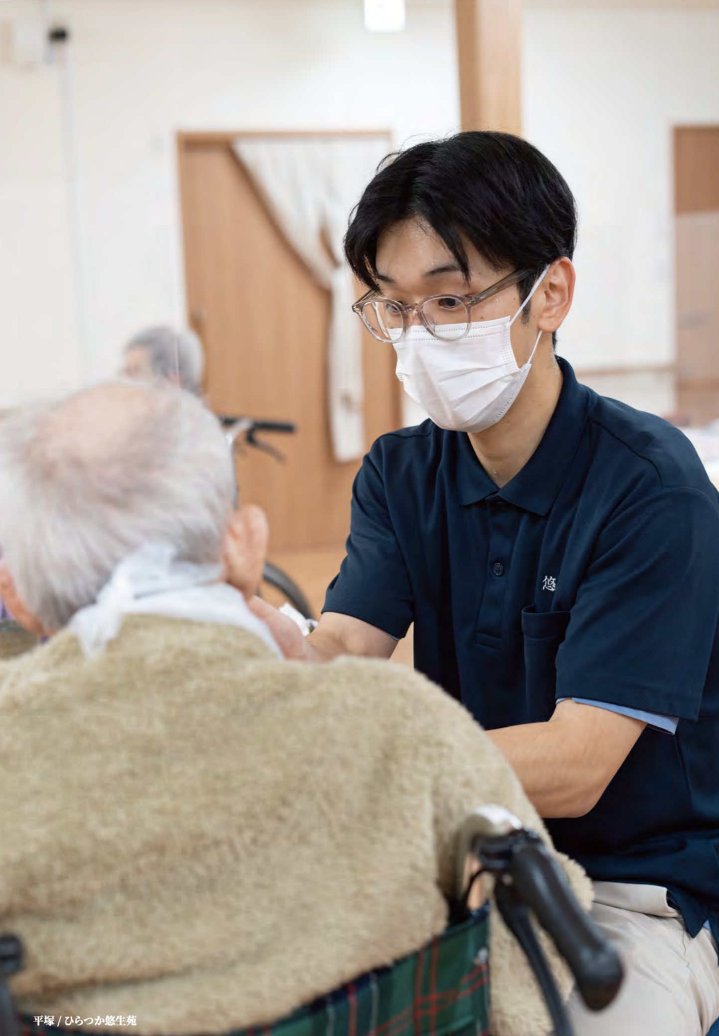
平塚 / ひらつか悠生苑